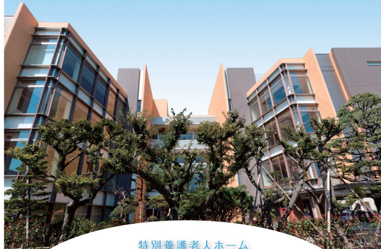
特別養護老人ホーム